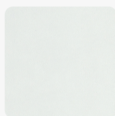
D129 PS53 BELA KAMEN Površinska tekstura Quarry